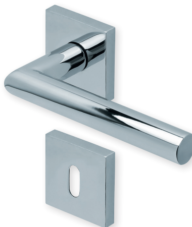
Drücker Edelstahl poliert Rosette Edelstahl poliert